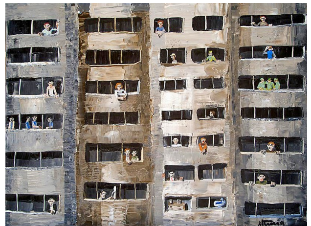
Ignacio Iturria, Sin título